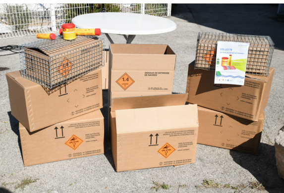
Exemple de matériel de collecte fourni par l'Aper Pyro.

Lors de l'achat de dispositifs de sécurité, le plaisancier peut déposer ses produits pyrotechniques périmés équivalents aux produits neufs achetés.