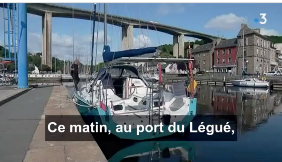
Reportage 1.51mn - France Télévision

L'ensemble des magasins, préalablement équipés des contenants permettant l'entreposage de ces produits, ont été collectés dans les plus brefs délais à l'issue des semaines de déposes ouvertes aux plaisanciers.